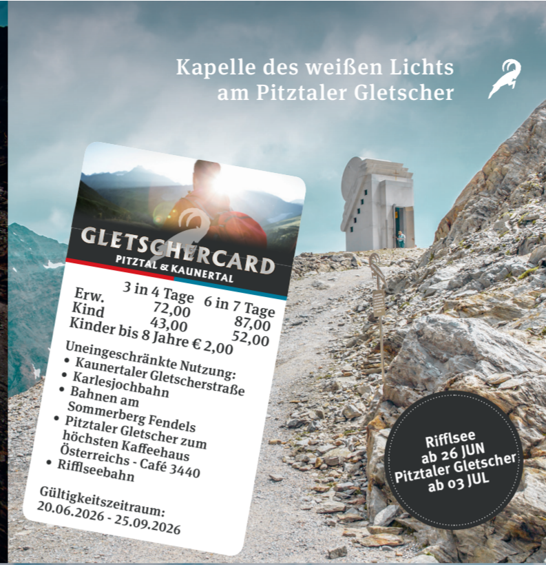
Kapelle des weißen Lichts am Pitztaler Gletscher