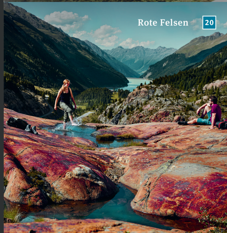
Rote Felsen 20