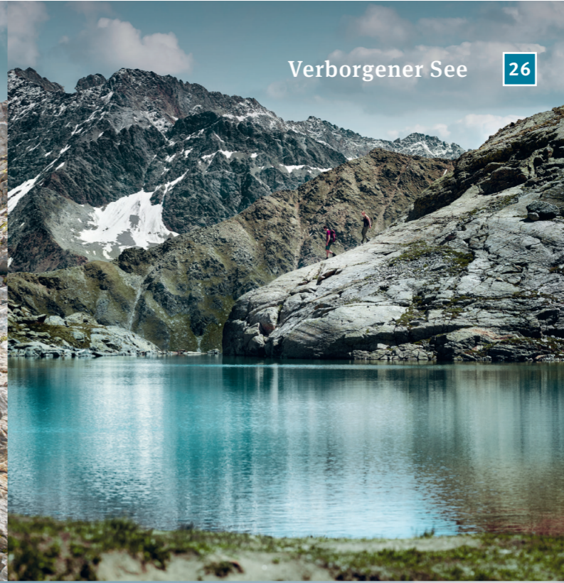
Verborgener See 26

Riffelsee ab 26 JUN Pitztaler Gletscher ab 03 JUL