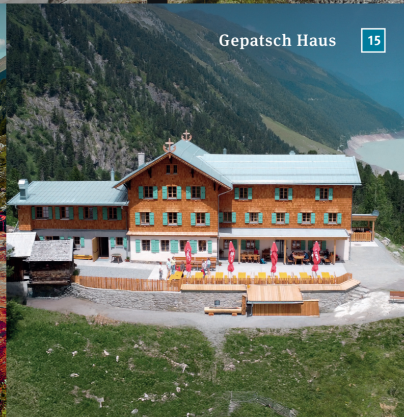
Gepatsch Haus 15